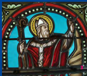
1. Vitrail de Stéphane Belzère, chapelle de tous les saints